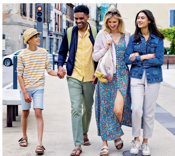
Doc. 2 Une famille en 2024.

1 Observe les doc. 1 et 2 et coche la bonne réponse.