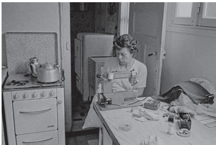
Doc. 3 Une femme en train de coudre à la machine.

Il y a cent ans, il y avait peu de magasins de vêtements et les vêtements coutaient cher. Les familles en possédaient peu et en prenaient soin.