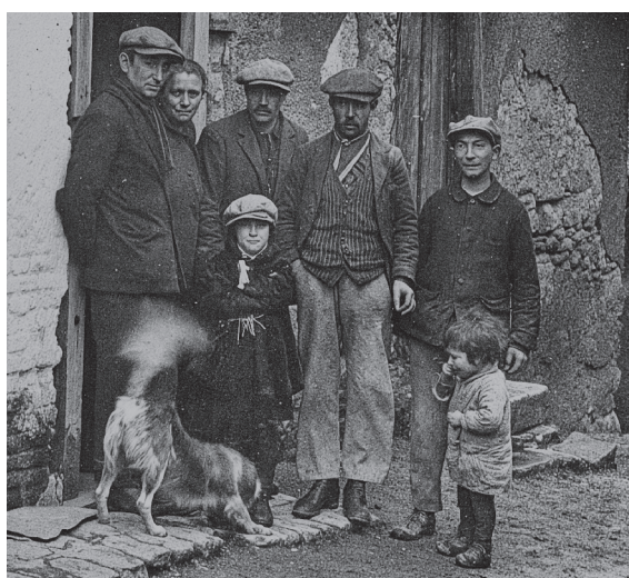
Doc. 1 Une famille vers 1936.