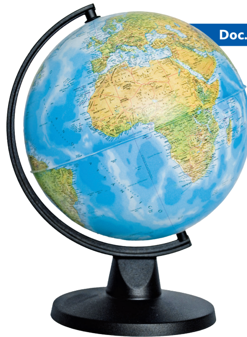
Doc. 2 Un globe terrestre.

1 Observe les doc. 1 et 2. Quelle forme à la Terre ?